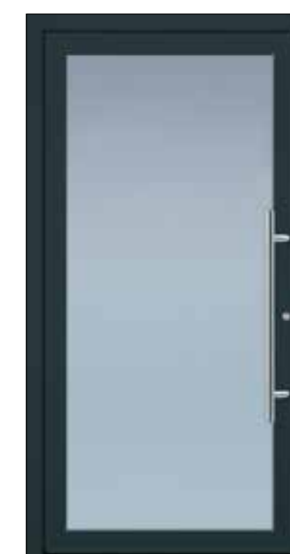
GANZGLASFÜLLUNG EXPRESS 20