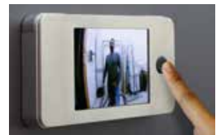
Aufgesetzt für Express