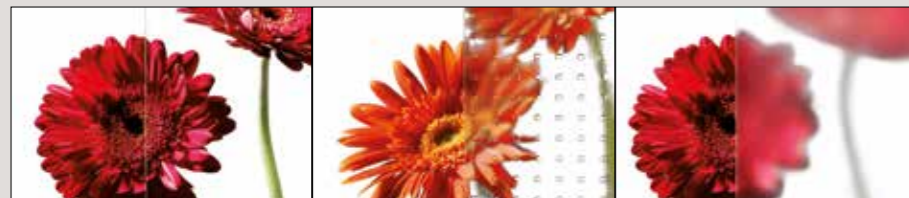
Verglasung: Klarglas (links) / Mastercarré (mitte) / Satinato (rechts)