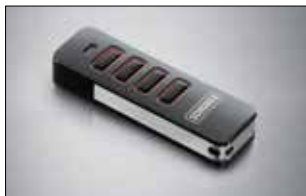
Pearl 4-Befehl Handsender