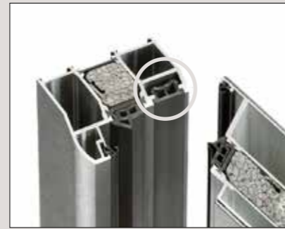
Montagenut für verdeckt liegende Rahmenverschraubung, deckt Schrauben ab, dadurch leichter zu Reinigen