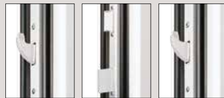
Dreiriegelhakenschloss für optimalen Einbruchschutz