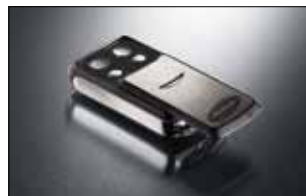
Slider 4-Befehl Handsender