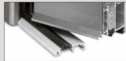
Wetterschenkel im Flügel vernietet, Wasser tropft von der Schwelle ab