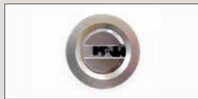
Rundrosette aus Edelstahl außen, inkl. Profilylinder mit Not- und Gefahrenfunktion (Aufschließen trotz innen steckenden Schlüssels)