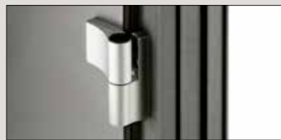
3 Türbänder dreidimensional einstellbar ohne Aushängen des Türflügels