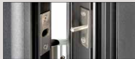
2 Bolzensicherungen im oberen und unteren Bereich verhindern das Aushebeln des Türflügels (Einbruchschutz)