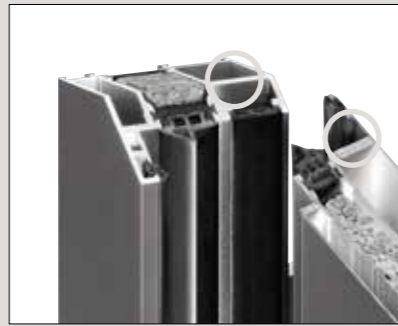
Wandungsstärke bis 3 mm bietet einen sicheren Halt für Schloss und Bandbolzen