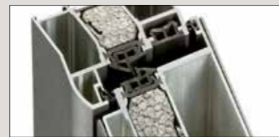
3 Dichtungsebenen garantieren optimalen Schutz gegen Wärmeverlust durch Zugluft