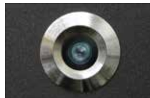
Groke Linse Schutzklasse IP65

+ Keine Aufnahmefunktion Preise auf Anfrage!