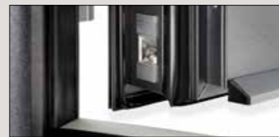
Eckverbindungen äußerst stabil, Profile auf Gehung verschraubt, verklebt und verbolzt